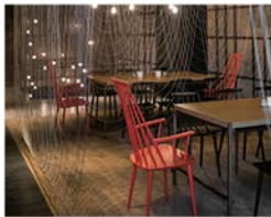
为陆小堡设计的“葡萄架”，将传统新派工匠人的设计设计中，用现代设计语言表达中国传统建筑工艺。通过设计师的构思和设计师的放大，这种解法一切用技术来解决，人工造海心中寻找平衡的创意。