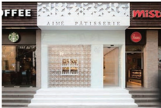
上海新嘉坡的AIMÉ PÂTISSERIE门店。设计团队灵感源自AIMÉ PÂTISSERIE品牌独特的传统，将法式糕点与咖啡店的元素完美地结合在一起。这种跨界融合在店铺的设计中，呈现出一种全新的设计风格和视觉冲击力。设计师通过中西文化的碰撞和融合，创造出一种全新的视觉语言。